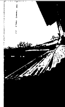
Foto 6: Cambio de lámina, reparación de captación y bajada de agua fluvial con tubo pvc 3"

Observación: Si es necesario se pueden agregar hojas adicionales y actualizar el número de hojas.