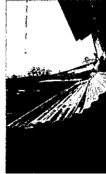
Foto 2: Sustitución de estructura de soporte de madera por metal.